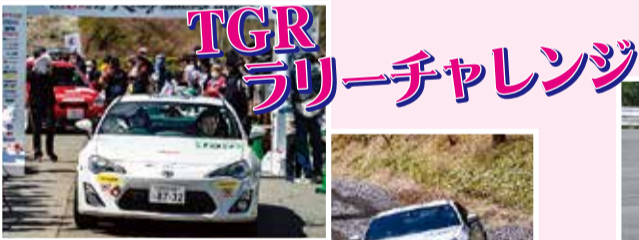
TGR ラリーチャレンジ

TOYOTA GAZOO Racing ラリーチャレンジに年3回 (八ヶ岳・渋川・富士山) 参戦しています。ラリーは山道を走る分、悪路が多く運転技術が求められますが、学生自身がドライバーを務め、過酷な状況下の車のメンテナンスや走行を通じてモータースポーツを全力で楽しんでいます。