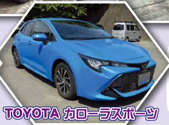
TOYOTA カローラスポーツ

新たに授業で使用する教材が増えました! オフロード車両やスポーツカー、大衆車などさまざま。多くの人気車種を揃え、走行実習など授業の中で活躍します。 オフロードコース・校内サーキットでの乗車や、実習場で触れる機会を楽しみにしていきましょう!!