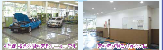
4号館 校舎外周や床をリニューアル