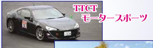
TTCT モータースポーツ