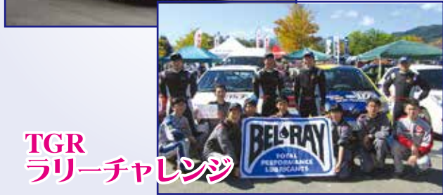
TGR ラリーチャレンジ