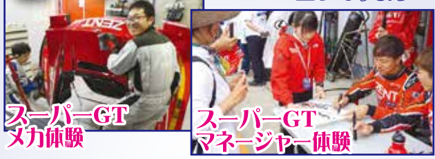
スーパーGT メカ体験