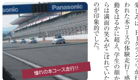
憧れの本コース走行!!

モビリティ安全運転講習 1年生を対象に安全運転講習が富士スピードウェイ内のモビリティで行われました。自分の運転技術ってどれくらい？車の限界って？そんな疑問を簡単に確認できるのがこの講習の面白さ。高速走行からの急ブレーキやスリップし易い路面でのブレーキング、ハンドルの操作の体験、また、ABSやVSC機構など、安全装置の体験も出来ました。 そしてなんと言っても一番の楽しみは、F1グランプリが行われた本コースの体験走行！感動をはるかに超え、学生の顔からは満面の笑みがこぼれていたのが印象的でした。