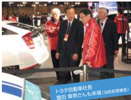
トヨタ自動車社長 豊田 章男さん(当校前理事長)

1月15、16、17日の3日間、約23万8千人の来場者となった東京オートサロン。今年も本校より昭和40年代のトヨタを代表するトヨタスポーツ800を「トヨタスポーツEV」として出展しました。この車は約1年半かけて研究科がレストアを行い、自動車研究部がEV(電気自動車)化を行いました。車両外装のデザインは、全校生徒から募集して決定しました。当日、説明員として足を運んだ学生達は、多くの来場者に緊張した様子でした。出展を終えて、長期間にわたって自分達の手がけた車を出展できた事に「楽しかった」、「良い経験が出来た」などのコメントと共に、成長した姿を見ることが出来ました。