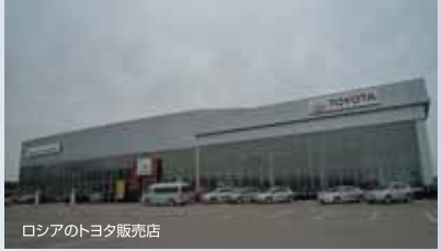
ロシアのトヨタ販売店

様サポートが必要 不可欠なのは言う までもありません。 最後に私から皆さ んに一言、実習など で部品を前にした 時に「どうして○ ○○なんだろ?」 と疑問を持つよう に心掛けて下さい。