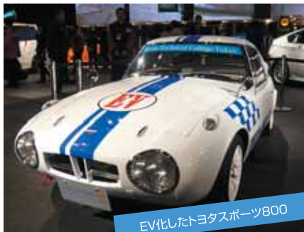
EV化したトヨタスポーツ800

祝卒業 自動車整備に魅力を感じ、当校に入学して2、4年が経ち、自動車整備科2年生、研究科、1級自動車科4年生の諸君が卒業の時を迎えました。今までの努力に対して敬意を表します。そして、これまで支えてくれた家族・友人・先生への感謝の気持ちを忘れないうでください。