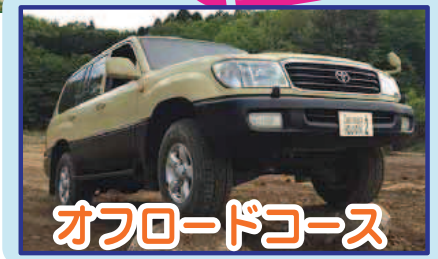
オフロードコース