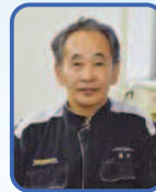
自動車整備2科 課長

心は強さを保持して取り組んでもらいたい。私自身も君たちに負けないように取り組んでいる事があります。それは、日本山岳耐久レースです。初めて出場した時は何度途中で止めようかと思つたことか、今年も22回目の完走に向け、諦めない心の強さを持って参加しますので、応援してもらいたい、そして私達も皆さんを応援します。『継続は力なり』