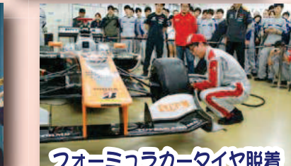
フォーミュラカータイヤ脱着