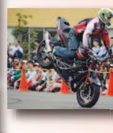
エクストリームバイク