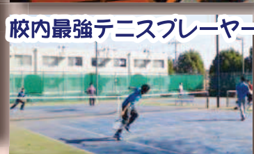
校内最強テニスプレーヤー