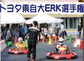
トヨタ東自大ERK選手権