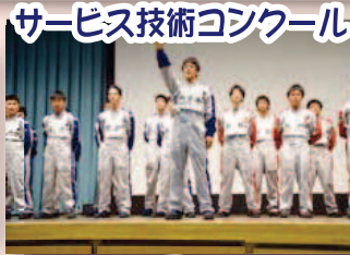
サービス技術コンクール