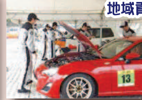
地域貢献車両点検