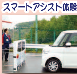
スマートアシスト体験