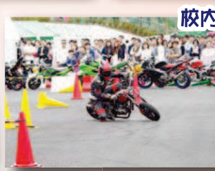
校内最速ライダー決定戦