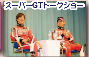
スーパーGTトークショー