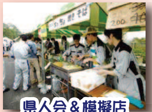
県人会 & 模擬店