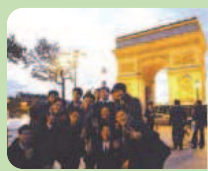
▲凱旋門をバックに