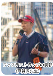
ファステストラップの表彰 (戸賀沢先生)

10月14日に日本EVフェスティバルに参加。「トヨタ東自大オールスターズ」チームが、ERKスペシャルクラス部門で優勝!