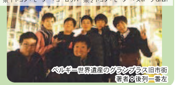
ベルギー世界遺産のグランプラス旧市街 審判員後列一番左

研修旅行で、ドイツ、ベルギー、フランスを回りました。TME※1、TMG※2で素晴らしい技術を学び、特別に風洞実験室も見せて頂きました。他にも凱旋門、エッフェル塔、ベントン博物館、ニルブルクリンク等の観光をしました。見るもの全てに感動しているばかりで、言葉にならない程、素晴らしいです。この貴重な経験は、私の財産であり、大切な思い出です。本当に行って良かったと心から思える研修旅行でした。※1 トヨタ・モーター・ヨーロッパ ※2 トヨタ・モーター・スポーツ GmbH