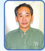
自動車整備2科 課長

が、不安と期待を胸に抱き、私からは、『石の上にも3年』という言葉を送りたい。どんな意味？知らなくてもいいですよ。・・・社会に出て3年位は、自分を作るための時間として、踏ん張ってもらいたい。自分に向いていない、やりたい事と違うと、現実から目をそわけたら気持ちになった時に、『石の上にも3年』を思い出して、その後の10年後、20年後に輝けるように自分を磨いて下さい。