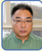
1級自動車/専攻科課長