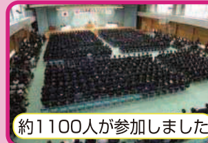
約1100人が参加しました