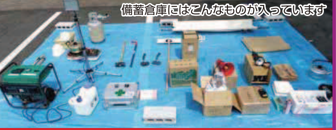
備蓄倉庫にはこんなものが入っています

◇ 避難場所に移動するとき、狭い道、塀ぎわ、川べりは避ける。 ◇ 注意が必要で、通学経路にどんな危険なものがあるのか、避難場所がどこにあるのかを一度チェックしておく事も大切です。 ◇ 学生寮で生活している時、頭部を保護し、揺れが収まるのを待つ。