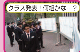
クラス発表!何組かな...?

(詳細は4面) この度、東日本大震災で被害を受けられた皆様に、心よりお見舞い申し上げますと共に、一日も早いご復興をお祈り申し上げます。 当校では震災発生後、新入生及び在校生の被害状況を調査しました。家屋の倒壊等はありませんでしたが、家族全員の無事を確認出来ました。