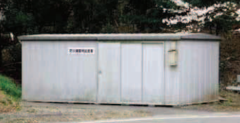
グラウンド奥にある備蓄倉庫

◇ 倒れそうなもの、落下しそうなものに注意する。 ◇ 戸を開けて出入口を確保する。 ◇ 備蓄倉庫は、揺れが収まるのを待つ。 ◇ 備蓄倉庫は、揺れが収まるのを待つ。 ◇ 備蓄倉庫は、揺れが収まるのを待つ。