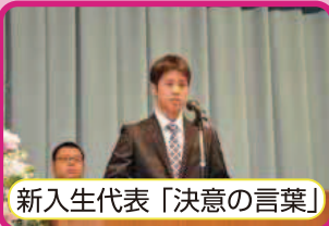
新入生代表「決意の言葉」

① とにかくやってみる ② 好きこそものの上手なれ ③ コミュニケーションを大切に 新一年生