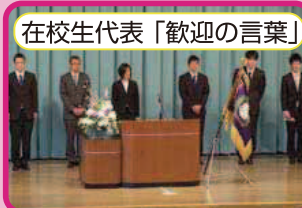
在校生代表「歓迎の言葉」