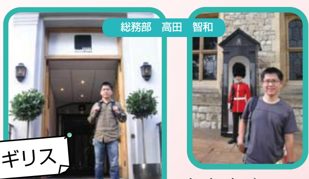
アビロードスタジオで!

「地球の歩き方」を片手に、イギリスのロンドンへ行ってきました。ホテルから徒歩でピートルズ所縁の地、アビー・ロードへ。ロンドン塔では、世界最大のダイヤモンド「アフリカの星」を見学後、衛兵と一緒に記念撮影。ただ、どこに行っても物価が高く、食べ物もあまり…。改めて日本の良さを感じることが出来ました。