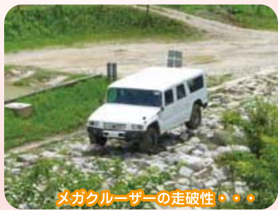
メカクルーザーの走破性……

自動車は、人々を様々な場所へ連れて行くしてくれる、すばらしいパートナーだと再確認しました。