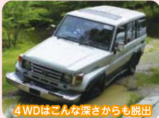
4WDはこんな深さからも脱出

「トヨタグループ研修旅行」 2年生は、名古屋研修旅行の研修先のひとつとして、猿投アドベンチャーフィールドに行ってきました。フィールドにはオフロードコースをメカクルーザーで同乗体験したことです。人間でも四つん這いでなければ登れない勾配を難なく登り、直径約1mの岩石がビッシリ敷き詰められている場所を難なく走るクルマの姿は圧巻でした。