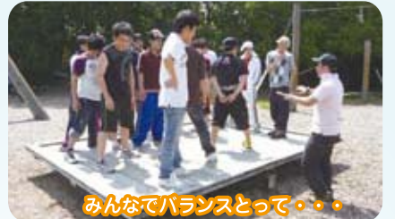
みんなでバランスとって……