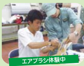
エアブラス体験中