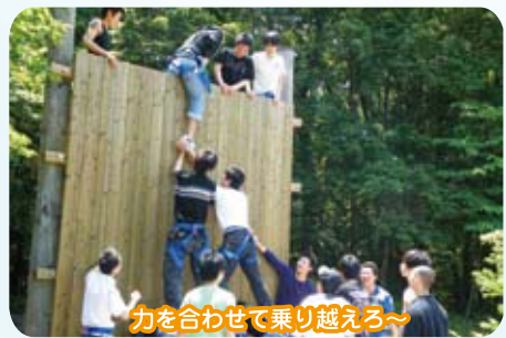
力を合わせて乗り越えろ～

1年生は、去る6月10日、16日に『高尾の森わくわくビレッジ』にて「プロジェクトアドベンチャー」という研修プログラムに参加してきました。