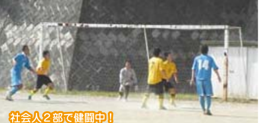
社会人2部で健闘中!!

当校サッカー部が所属している八王子サッカー協会は、創立40周年を迎えました。当校は、39年間所属しており、先日開催された記念式典で表彰されました。現在2部リーグ参戦中で、3勝1敗1引き分けという好成績です。この先、相手チームは強豪揃いなので日々の練習を実践に近付けると共に、1部に昇格できるように全力を尽くしていきたいです。