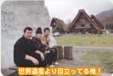
世界遺産より目立ってる俺!

研究科研修旅行 研究科は、世界遺産である合掌造りで有名な白川郷の集落を見学し、夜には自然を体感するナイトハイクを行いました。ナイトハイクでは日頃あまり味わう事の出来ない暗闇の中を、月の明りだけの状態で約1時間自然を感じました。