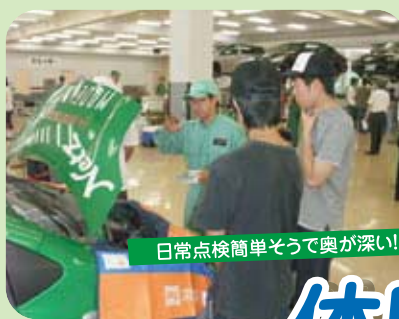
日常点検簡単そうで奥が深い!