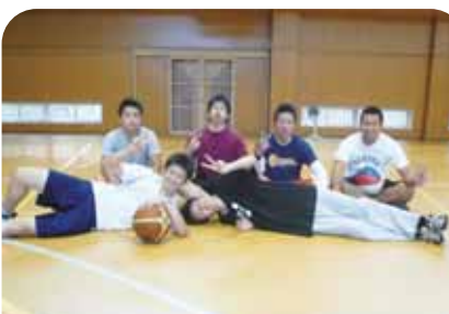
バスケットボール優勝 39期3・4組チーム