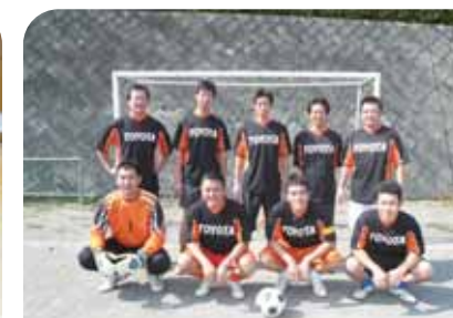
サッカー優勝 職員チーム